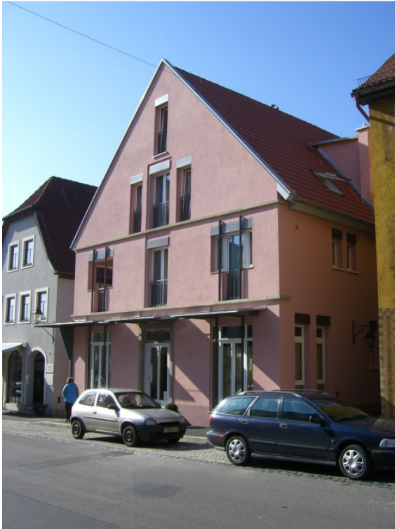
Das Iff-Haus nach dem Wiederaufbau 2007

Durch die Hilfe meines Vaters, der von den Amerikanern einen Passierschein bekam, erhielt er nach langem Suchen in Bad Kissingen Wasserleitungsrohre, die für die defekte Hauptleitung paßten. Nun gab es endlich wieder Wasser aus der Leitung und das tägliche Leben konnte wieder in Arnstein weiter gehen. Aber der Krieg war noch nicht zu Ende. Es wurde immer weiter gekämpft und Deutschland von den Alliierten erobert war.