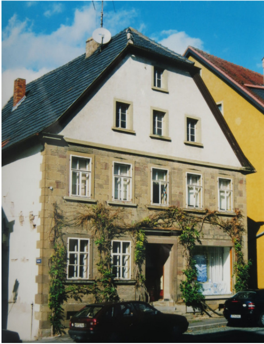
Iff-Haus um 2001