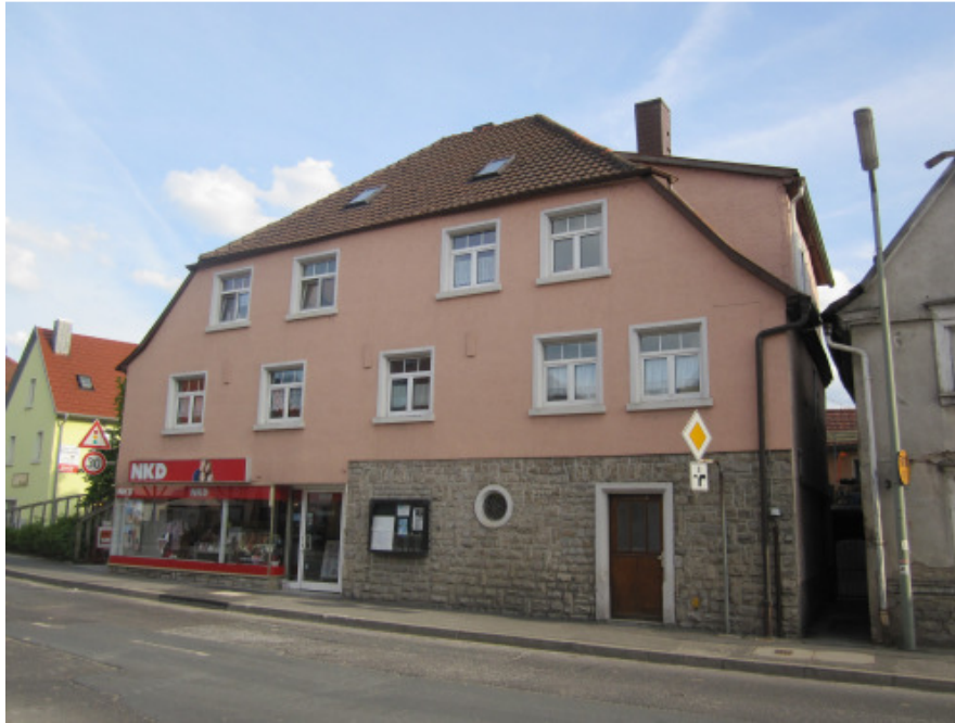
Hier in dem Gebäude Karlstadter Straße 1 war früher die Konditorei Klett. Hinter dem Gebäude befand sich der ‚Klett’sche Brunnen‘.

Aber Wasser konnten wir nicht mehr holen, denn die Amerikaner hatten am Bücholder Berg Stellung bezogen und schoßen ununterbrochen auf Arnstein. Von fliehenden Soldaten hörten wir, daß der Feind in Heugrumbach ist. Und tatsächlich kamen die ersten Amerikaner auf Gummisohlen unser Gäßchen herauf, das Gewehr im Anschlag und in der anderen Hand ein Stück Kuchen, das sie im Nebenhaus auf dem Tisch fahnden. Die Bewohner waren geflohen.