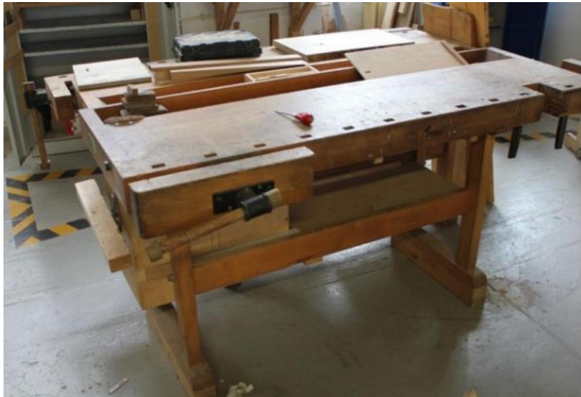
Eine solche Hobelbank dürfte sowohl bei Stoy als auch bei Söder gestanden haben

Forst-, Kassen- und Rechnungswesen zuständig. Außerdem wurde er als Stadtratsvertreter zur Schulpflegschaft delegiert. Daneben war er noch als Schätzer für die Mieteinwertung tätig. 1