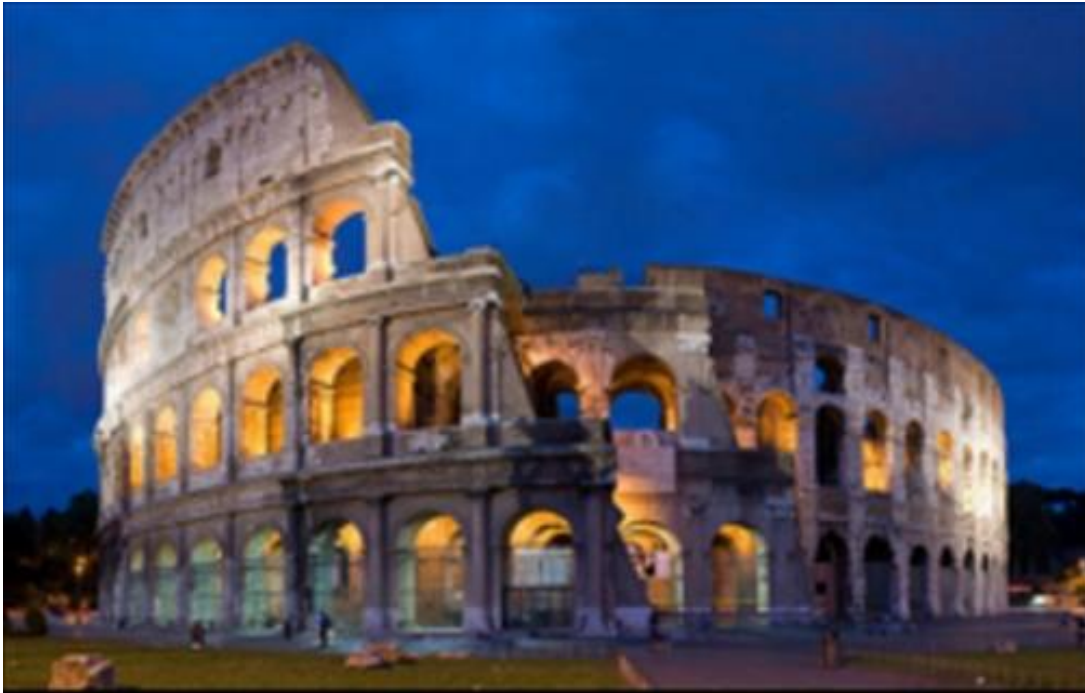
Das Kolosseum in Rom

Bürgern Arnsteins vorlegte, um hier ein besseres Entree zu finden. Der Brief findet sich heute noch im Kopialbuch des Stadtarchives Arnstein.