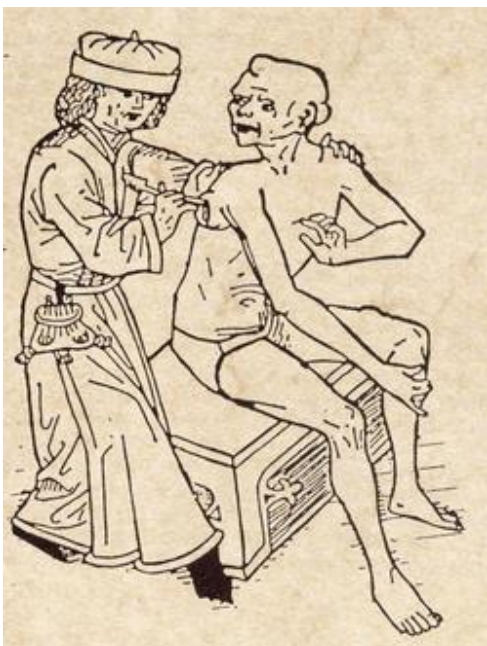
Arzt beim Aufstechen einer Pestbeule

benötigte selbstverständlich auch eine medizinische Versorgung. Dazu kam, dass die sanitären Verhältnisse im 15. Jahrhundert äußerst bescheiden waren. Nicht umsonst weist der Chronist auf die Pestkranken hin, die Deschendorff heilte.