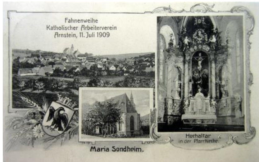
Sonderkarte zur Fahnenweihe der KAB 1909

Sie sollten die Jugend vor der Annahme von Stellen in den bezeichneten Gegenden und den Großstädten warnen und ihren Arbeit und Unterhalt suchenden Pfarrangehörigen behilflich sein, an besseren Orten Arbeit und Verdienst zu finden.