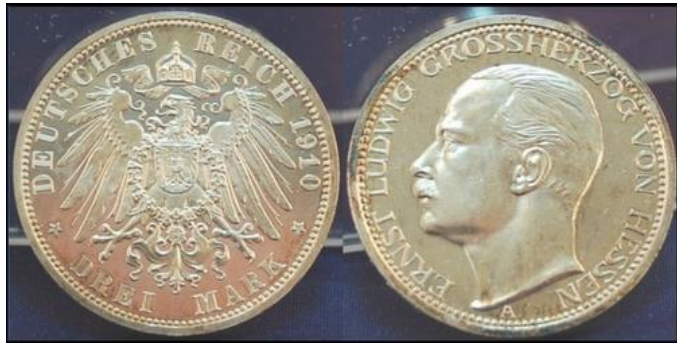
Ein männlicher Arbeiter erhielt am Tag drei Mark

Auch damals wurden die Frauen schlechter behandelt als die Männer. Dazu kam, dass ab 1919 langsam die Inflation spürbar wurde und die gewährten Sätze sicherlich immer nur sehr zögernd angepasst wurden.