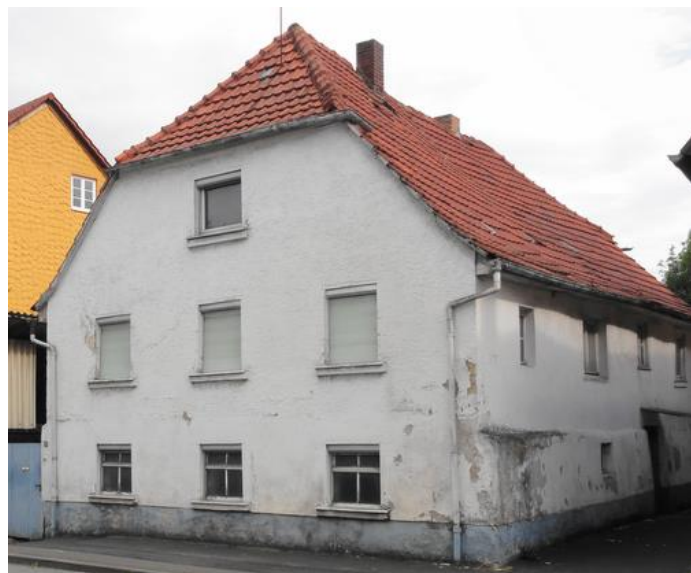
Dieses ehemalige Haus in der Karlstadter Str. 9 war zeitweise ein Armenhaus

Diese Arbeitshäuser stellten eines der wesentlichen Merkmale armenpolitischer Bemühungen seit der Mitte des 16. Jahrhunderts dar. Dort sollten von Armut betroffene Menschen, vor allem Bettler, aufgenommen und damit aus der Öffentlichkeit entfernt werden. Gleichzeitig nutzte man die Arbeitskraft dieser Menschen, indem sie gemeindliche Aufgaben übernehmen mussten. Im 19. Jahrhundert hieß es dann auch: ‚Wer nicht arbeitet, soll auch nicht essen!‘