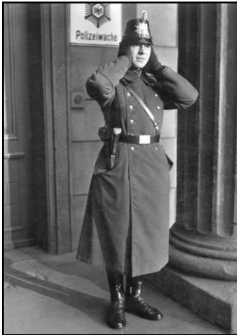
Schutzleute mussten den Arbeitswilligen helfen

bedenkenlos vom Einkommen seiner Kollegen die Arbeitslosenunterstützung abziehen lässt, um selbst nichts zu tun.