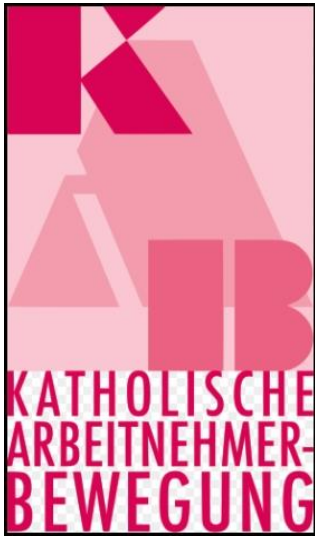
Logo der KAB, die den Arbeitern und auch den Arbeitslosen im 19. Jahrhundert helfen sollte

Vereine verursachen würden. Die Verhältnisse der gegenwärtigen Zeit verlangten gebieterisch diese Opfer von den Priestern.