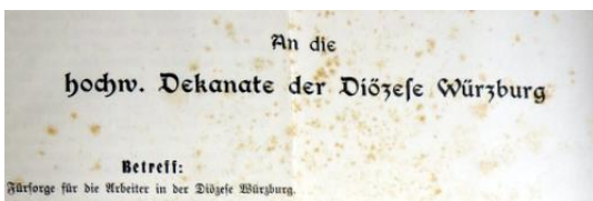
Rundschreiben der Diözesan-Verwaltung Würzburg

Schließlich wird in dem Rundschreiben auf die großen Gefahren hingewiesen, welche die katholische Jugend - Jünglinge und Mädchen - in religiöser und sittlicher Hinsicht ausgesetzt seien, wenn sie in Frankfurt, Hanau, Offenbach und anderen Fabrikstädten, in den Taunusbädern und während der Sommerzeit in den großen hessischen Gütern eine Stelle annehmen würden. Die bisherigen Erfahrungen hätten gezeigt, dass zwei Drittel dieser Jünglinge und Jungfrauen sittlich und religiös zu Grunde gehen würden. Es sei daher dringend notwendig, dass die Seelsorger, besonders im Spessart, in der Rhön, in der Main-, Saale- und Werngengend öfter auf die Gefahr aufmerksam machen würden.