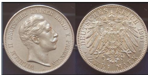
Eine Arbeitnehmerin erhielt nur zwei Mark

Der Distrikt behielt sich in § 15 vor, die Unterstützung auch in Sachbezügen zu gewähren. Dafür wurden Beihilfen oder Renten aus der Arbeiter- und Angestelltenversicherung nur