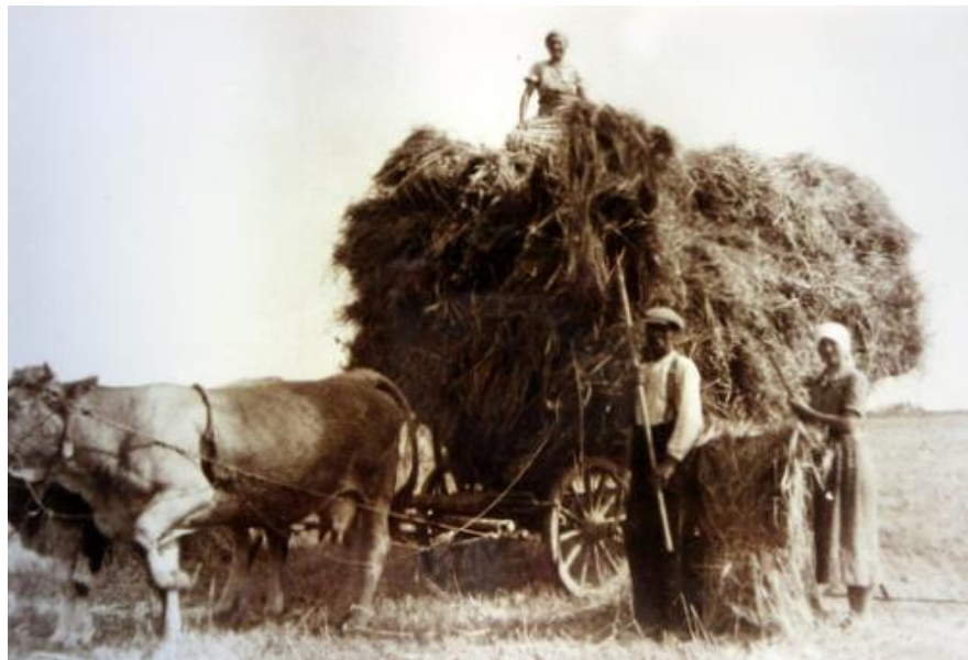
In der Landwirtschaft gab es im 19. Jahrhundert im Sommer fast immer Arbeit

Die Pfarrer und die Kapläne sollten sich nicht von der Mühe abhalten lassen, welche die Gründung und Betreuung dieser