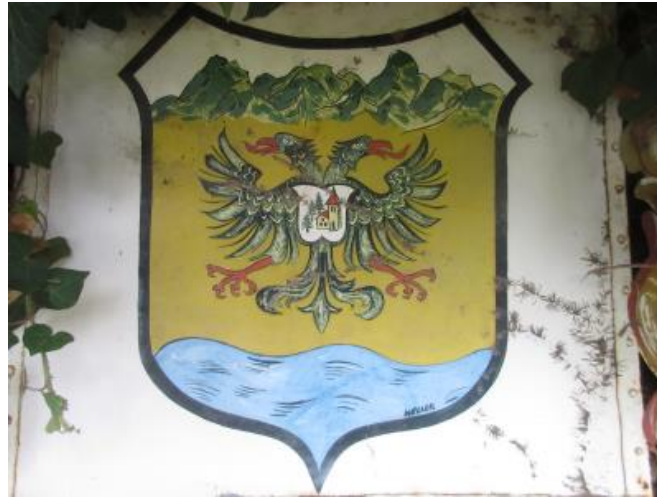
Dieses Familienwappen des Autors malte 1977 Georg Heller

Heute stellt das Haus mit seinen drei Stockwerken und einem Keller wieder ein Schmuckstück der Altstadt dar.