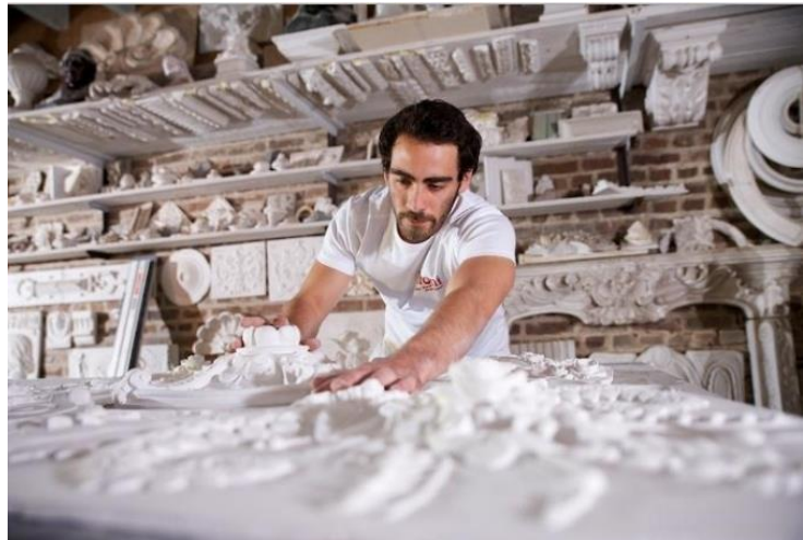
So sah die Arbeit eines Stuckateurs aus