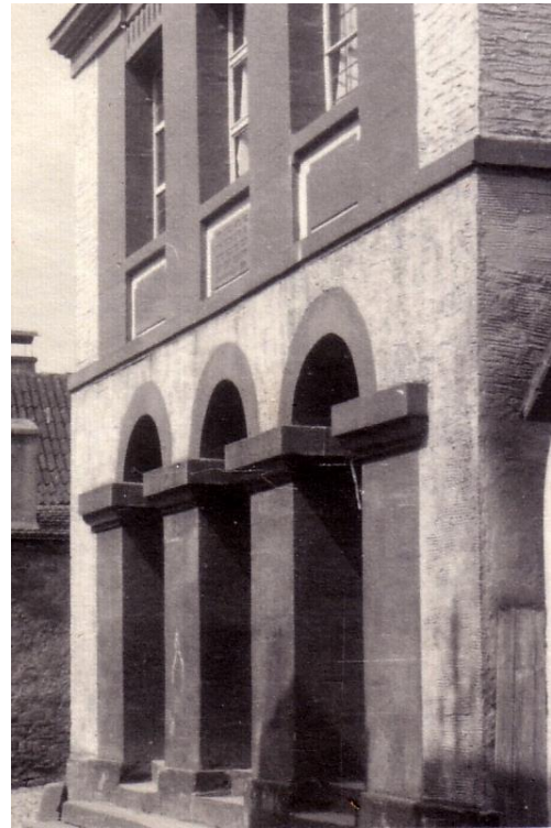
Die Synagoge sollte ursprünglich weiter oben in der Goldgasse gebaut werden (Foto Michael Fischer 1936)

es 1845 an seine Frau Lina weiter vererbte. Diese verkaufte es an Johann Moritz, der 1857 verstarb.