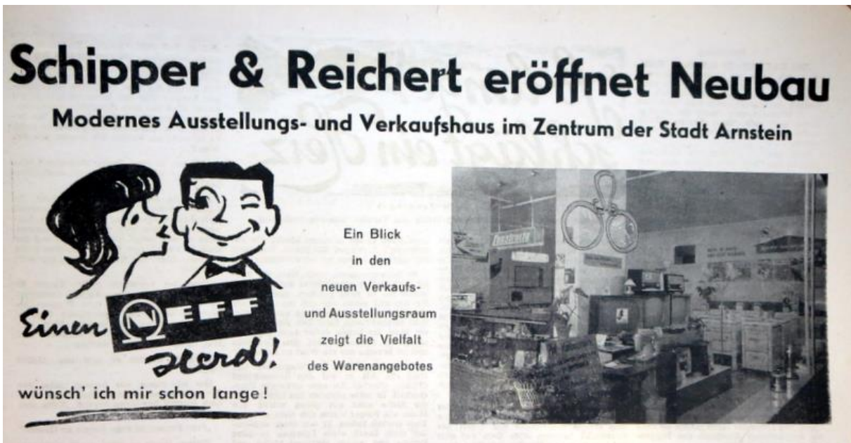
Eine Anzeige in der Werntal-Zeitung vom 8. Oktober 1960