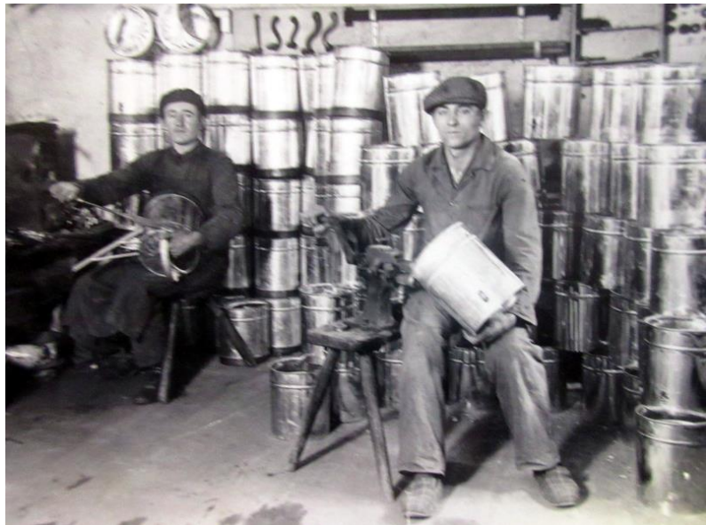
Spengler arbeiteten nicht nur auf dem Bau; auch für das Herstellen von Gefäßen waren sie zuständig.