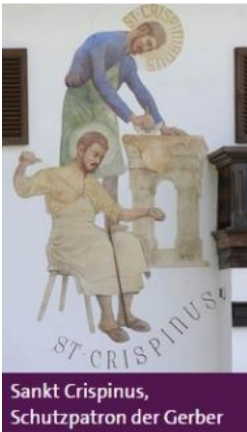
Sankt Crispinus, Schutzpatron der Gerber