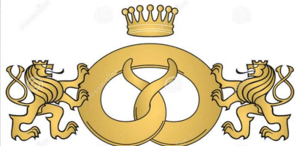
Zunftzeichen der Bäcker