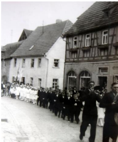
Kommunionumzug in den fünfziger Jahren

gesellschaftlichen Veranstaltungen eine gute Figur abgab. So soll sie beim Gesangverein „Cäcilia“ mit ihren beiden Schwestern eine „gute Stimme“ abgegeben haben. Zeitgenossen erinnerten sich, dass die Zangs-Mädchen mit Hüten so groß wie Wagenräder promenierten.‘