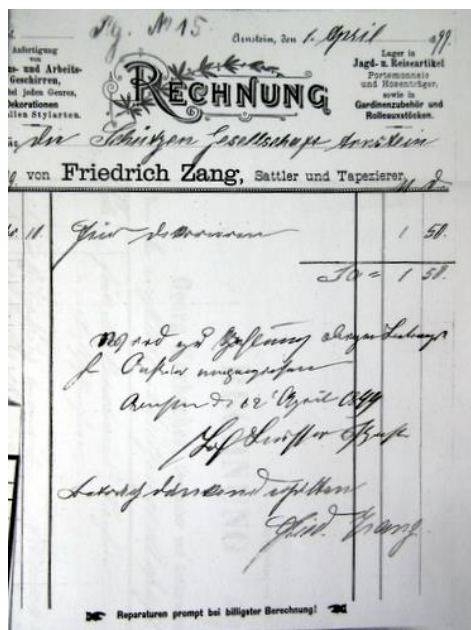
Rechnung von 1899

gesellschaftlichen Veranstaltungen eine gute Figur abgab. So soll sie beim Gesangverein „Cäcilia“ mit ihren beiden Schwestern eine „gute Stimme“ abgegeben haben. Zeitgenossen erinnerten sich, dass die Zangs-Mädchen mit Hüten so groß wie Wagenräder promenierten.‘