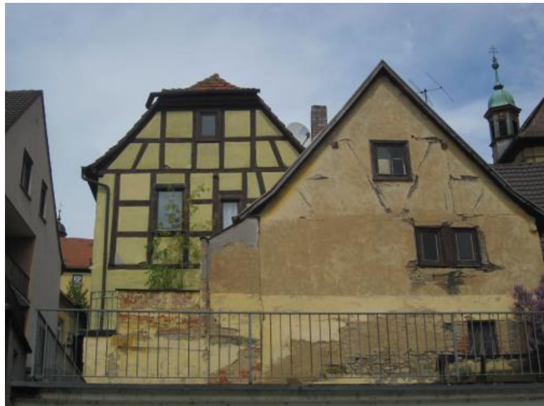
Die Rückseite des Hauses Marktstr. 44