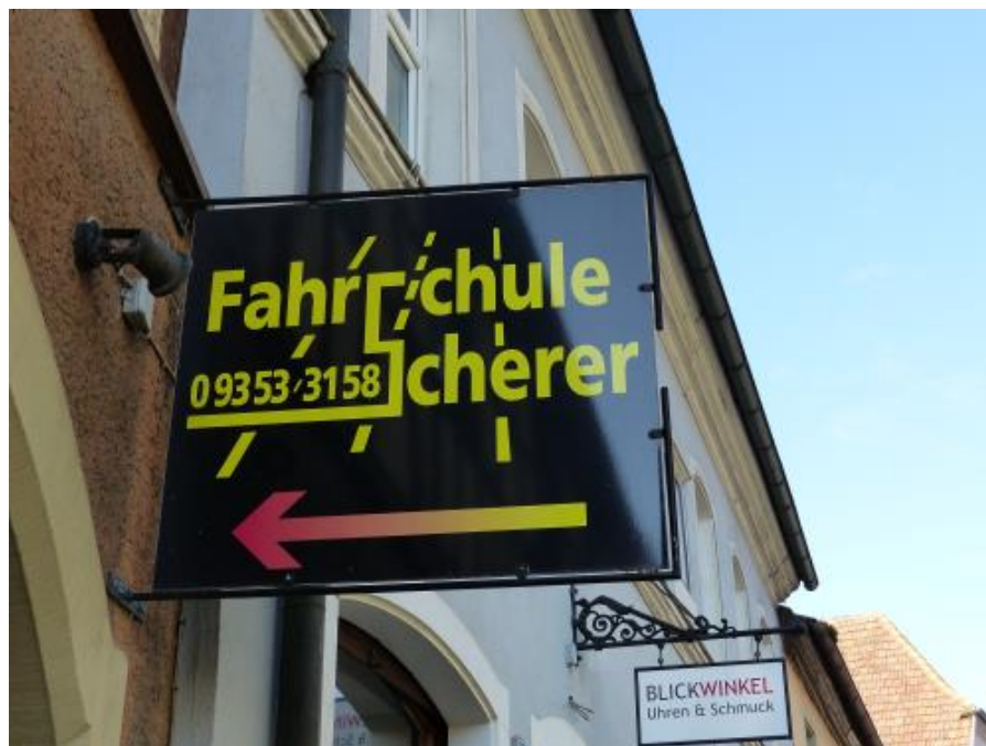
Derzeit ist die Fahrschule Scherer in dem Gebäude Marktstr. 44 untergebracht

Um 1990 wurde das Anwesen an eine Familie Müller aus Reuchelheim verkauft. Nachdem zwischenzeitlich einige kleinere Geschäfte ihr Glück in dieser Lage versuchten (u.a. Stoffe, Brillen), möchte heute die Fahrschule Scherer junge Menschen zu einem Führerschein verhelfen.