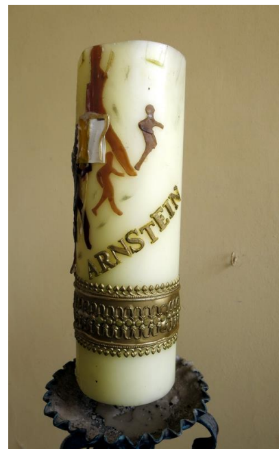
Die Kerze der Kreuzbruderschaft, die bei Beerdigungen der Mitglieder angezündet wird

Spengler waren auch für Dachrinnen zuständig. Besonders tüchtige machten sogenannte Chimären an die Gebäude wie hier bei der VR-Bank in Arnstein.