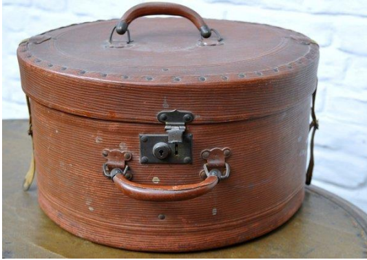
Hutschachtel aus dieser Zeit