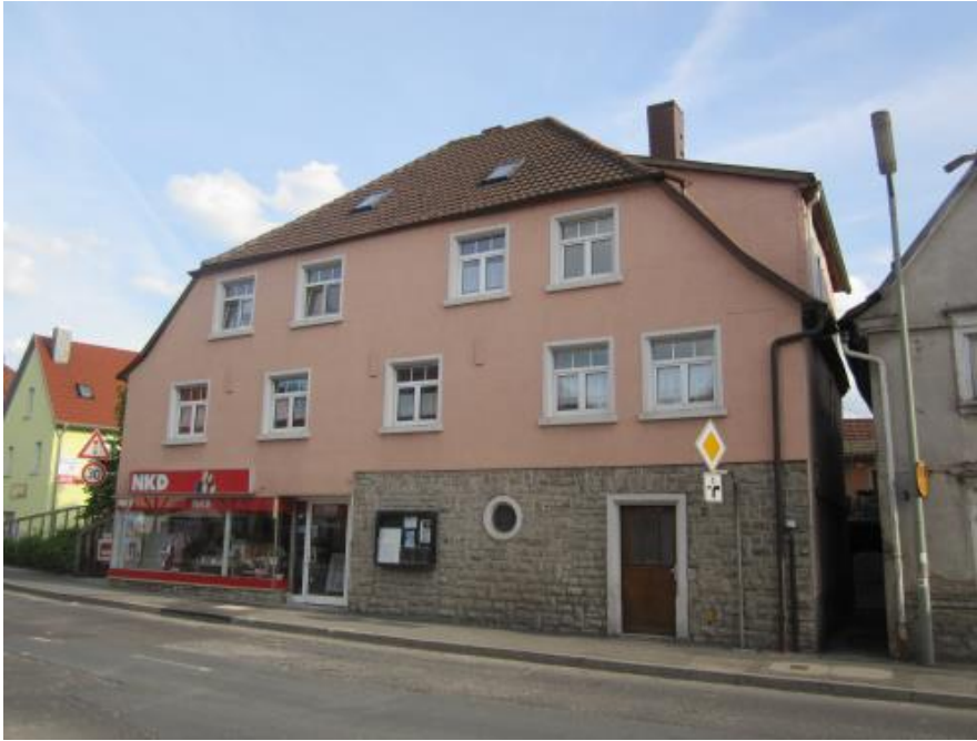
Hier in dem Gebäude Karlstadter Straße 1 war früher die Konditorei Klett. Hinter dem Gebäude befand sich der ‚Klett’sche Brunnen‘.

Aber Wasser konnten wir nicht mehr holen, denn die Amerikaner hatten am Bücholder Berg Stellung bezogen und schoßen ununterbrochen auf Arnstein. Von fliehenden Soldaten hörten wir, daß der Feind in Heugrumbach ist. Und tatsächlich kamen die ersten Amerikaner auf Gummisohlen unser Gäßchen herauf, das Gewehr im Anschlag und in der anderen Hand ein Stück Kuchen, das sie im Nebenhaus auf dem Tisch fahnden. Die Bewohner waren geflohen.