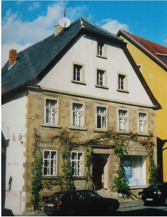
Iff-Haus um 2001