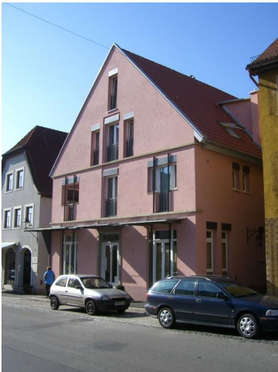
Das Iff-Haus nach dem Wiederaufbau 1907

Durch die Hilfe meines Vaters, der von den Amerikanern einen Passierschein bekam, erhielt er nach langem Suchen in Bad Kissingen Wasserleitungsrohre, die für die defekte Hauptleitung passten. Nun gab es endlich wieder Wasser aus der Leitung und das tägliche Leben konnte wieder in Arnstein weiter gehen. Aber der Krieg war noch nicht zu Ende. Es wurde immer weiter gekämpft und Deutschland von den Alliierten erobert war.