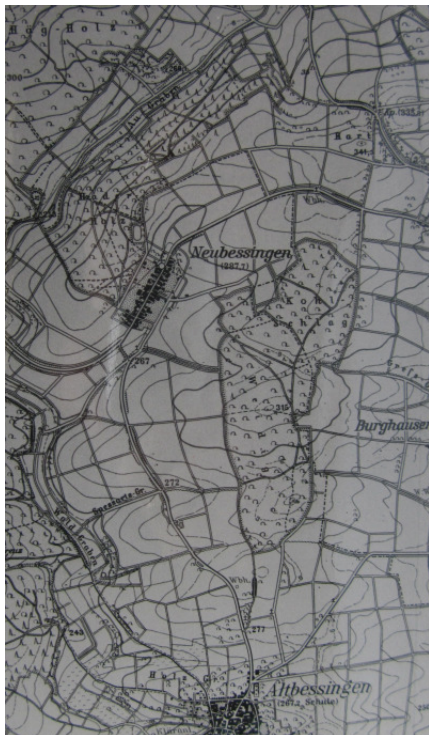
Lage von Neubessingen, nördlich von Altbessingen und nordwestlich von Burghausen