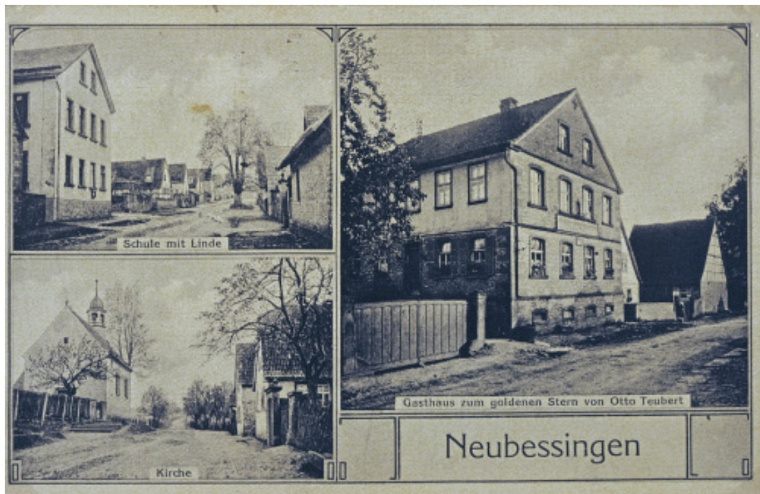
Schöne Jugendstil-Ansichtskarte aus Neubessingen, etwa um 1910