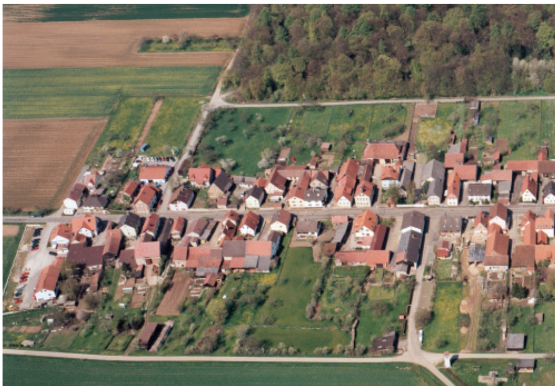
Luftbild von Neubessingen aus Jahr 2001