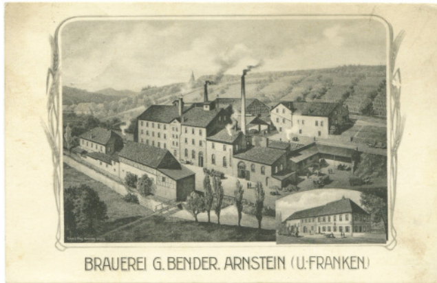
Die Bender-Brauerei, wahrscheinlich Lieferant für beide Wirtschaften, aus der Zeit um 1900