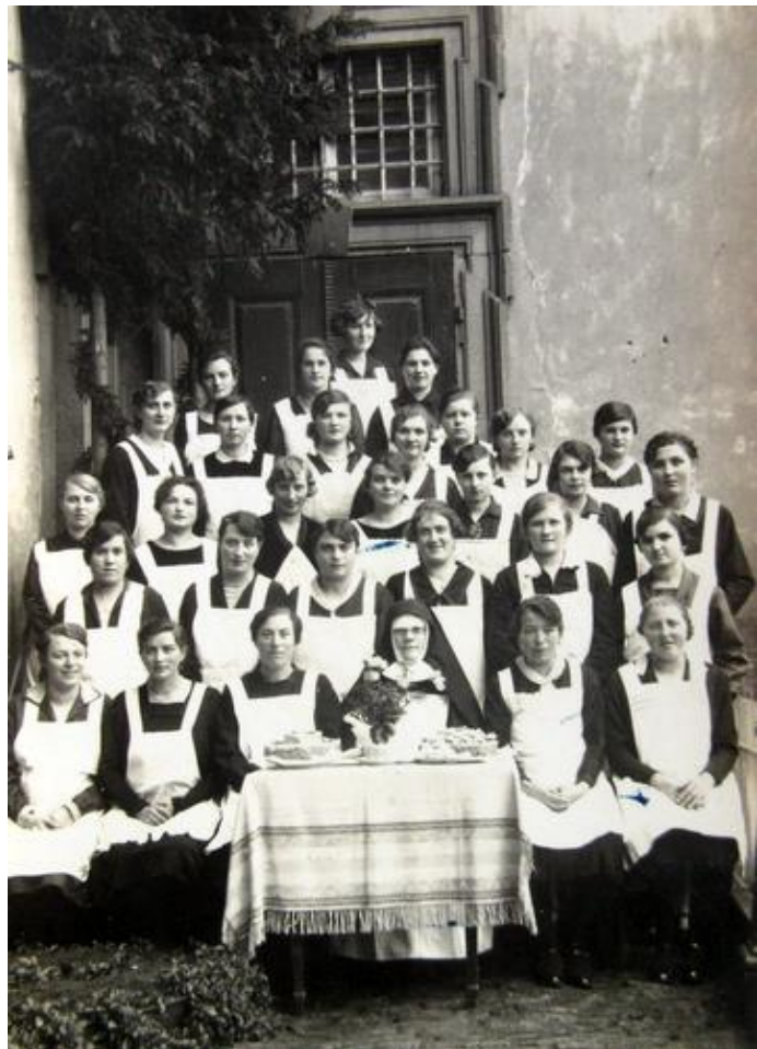
Die Schwester vom Orden des Göttlichen Erlösers wirkten nicht nur als Krankenschwestern, sondern waren auch in der Erziehung sehr aktiv. Hier bei einem Kochkursabschluss 1929

Zu dieser Zeit gab es für den ganzen Distrikt Arnstein einen Arzt. Die Hauptverantwortung trugen die Schwestern vom ‚Orden des göttlichen Erlösers‘. Sie waren im Schwesternhaus in der Marktstraße 39 untergebracht und versorgten die Bürger zu Hause. Die Überlegung war gut und durchführbar.