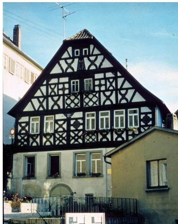
Das Schwesternhaus in der Marktstraße 39. Hier wohnten bis auf die im Altenheim und Krankenhaus tätigen Schwestern

Da bei den Schwestern in Arnstein eine rege Fluktuation herrschte, sind nur wenige Namen überliefert. Um diese Zeit könnten vier Schwestern namentlich benannt werden, die sich um die Kranken, sowohl im Krankenhaus als auch ambulant, kümmerten: