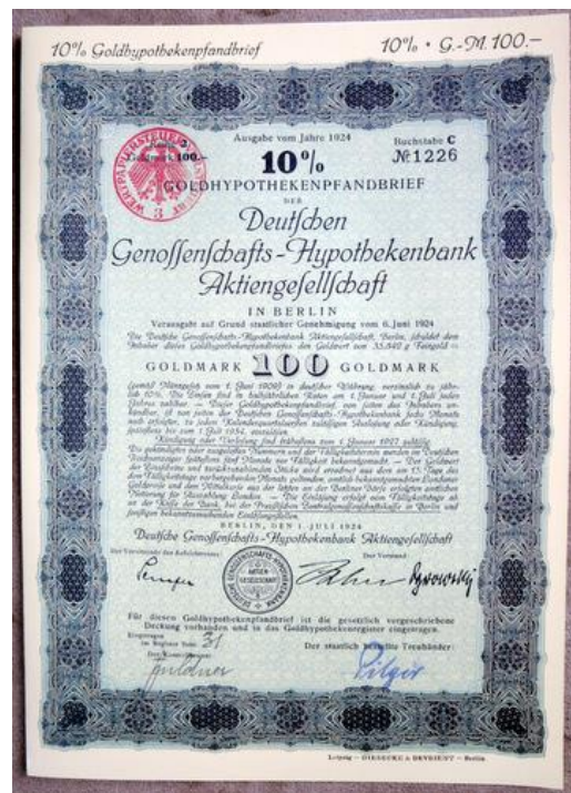
Ein Großteil des Vermögens war in Pfandbriefen angelegt

In den nächsten fünfzehn Jahren stieg das Vermögen durch die Zinsen auf 2.118,36 RM zum 1. Januar 1948. Doch durch die Abwertung nach dem Zweiten Weltkrieg am 20. Juni 1948 wurde das schon geringe Vermögen noch einmal wesentlich reduziert.