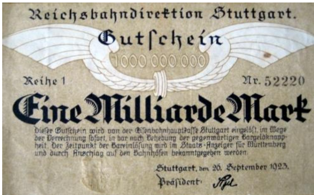
Durch die Inflation 1923 wurde ein Großteil des Vermögens hinweggespült

Deshalb beschloss der Stadtrat am 8. Juni 1954, diese und andere Stiftungen aufzulösen und alle Beträge auf die noch allein bestehende, damals die größte, Cordula-Beck-Stiftung zu übertragen.