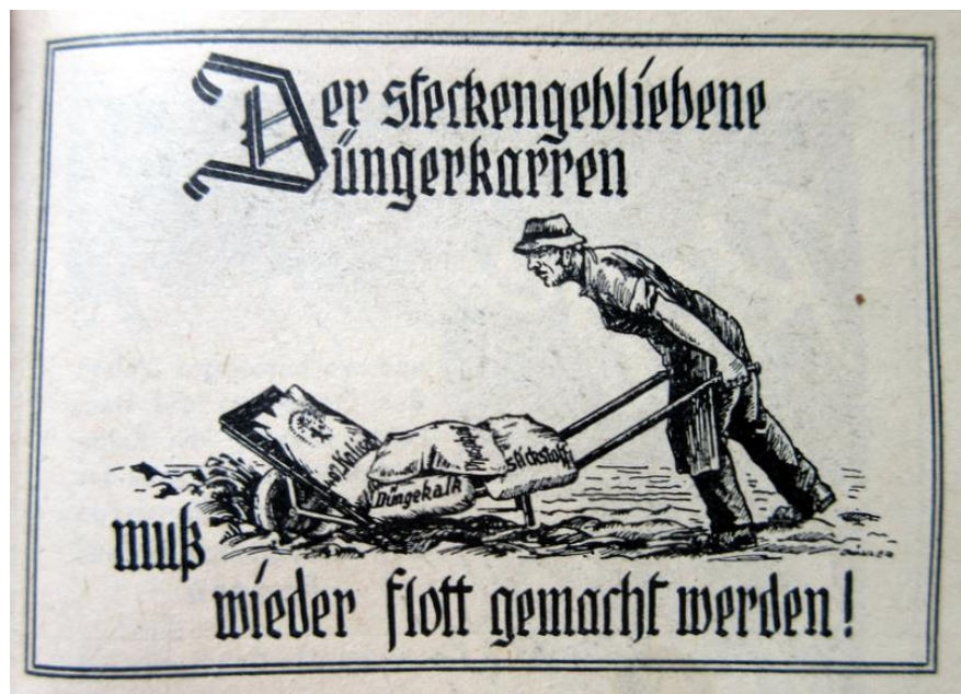
Auch in Kaisten war das Warengeschäft ein wichtiges Standbein des Vereins