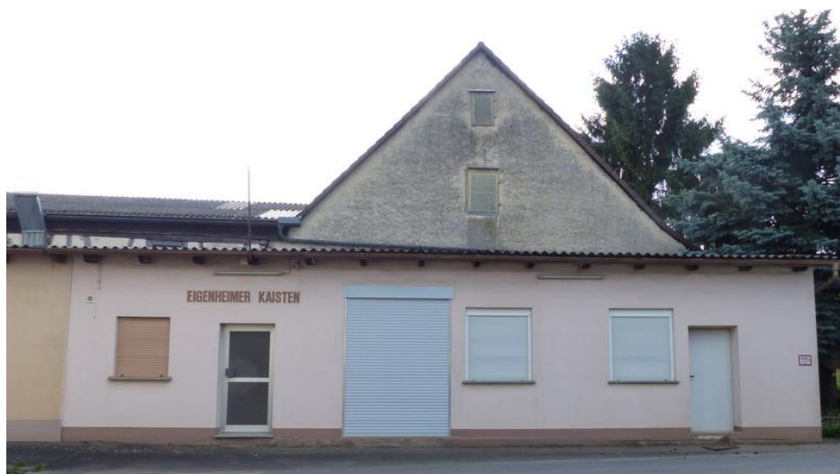
Das frühere Gebäude der Raiffeisenkasse Kaisten in der Vasbühler Straße

Das deutsche Einheitsstatut wurde bei der Generalversammlung am 38. Mai 1963 angenommen. Gleichzeitig wurde auch die Umwandlung in eine Genossenschaft mit beschränkter Haftpflicht beschlossen: nunmehr: Raiffeisenkasse Kaisten eGmbH .