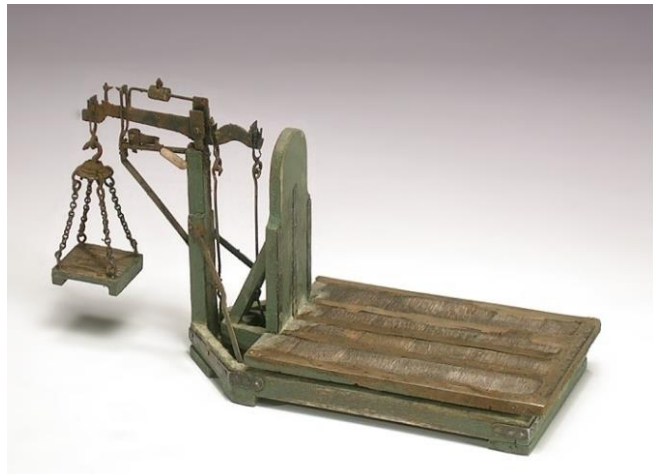
Eine Dezimalwaage gehörte zur unbedingten Ausstattung im Warengeschäft

Die Eintragung der bH usw. wurde von Ihnen am 25.10.1961 vorgenommen, wobei anscheinend wiederum ein nicht ganz ausgefülltes Statut vorgelegt und auch bestätigt wurde. Das von Ihnen bestätigte Statut (Satzung A 111) füge ich vorsorglich bei, woraus Sie ersehen wollen, daß § 23 überhaupt nicht ausgefüllt ist, während §§ 6, 14 und 35 nicht den Beschlüssen der Generalversammlung entsprechen. Ich weiß das mit absoluter Sicherheit, da ich diese GV (Generalversammlung) selbst führte und - wie Sie aus den anderen Einreichungen aus dem mir zugeteilten Bereich Arnstein und Karlstadt ersehen können - einheitliche Regelungen beschließen ließ (z.B. § 6 habe ich stets mindestens 12 Monate einsetzen lassen).