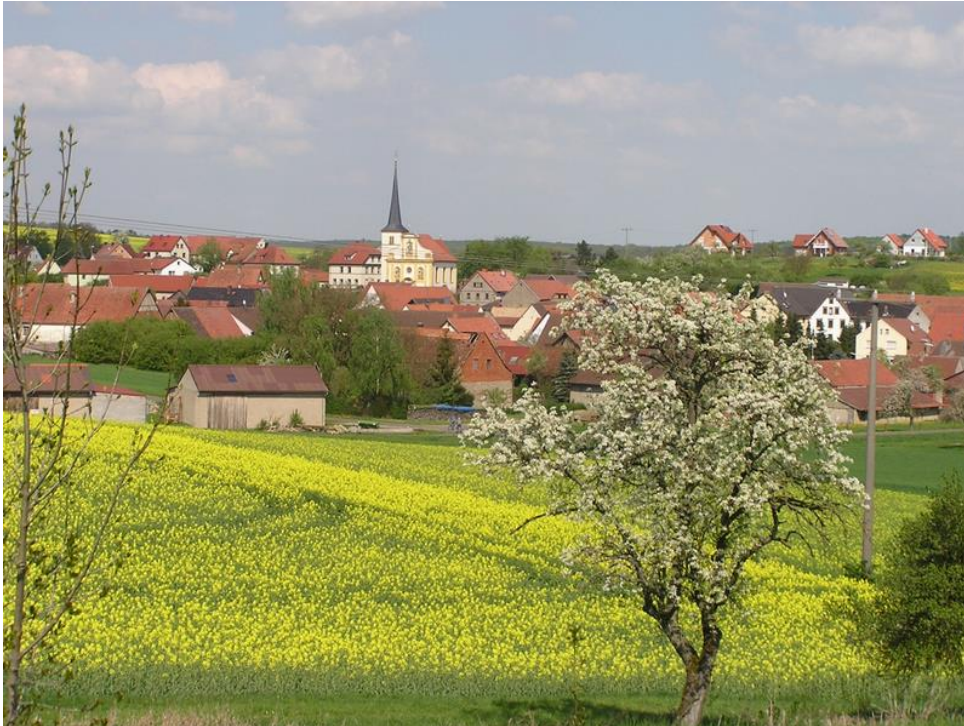
Man einigte sich dann auf den anderen Nachbarort Schwemmelsbach