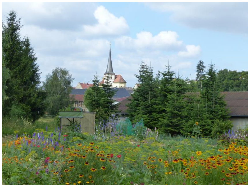
Ein möglicher und sinnvoller Partner zu dieser Zeit wäre die Raiffeisenkasse Schwebenried gewesen

Die Fusion mit der Raiffeisenkasse Schwebenried wäre eine nachvollziehbare Entscheidung gewesen. Hatten doch Schwebenried und Kaisten viele