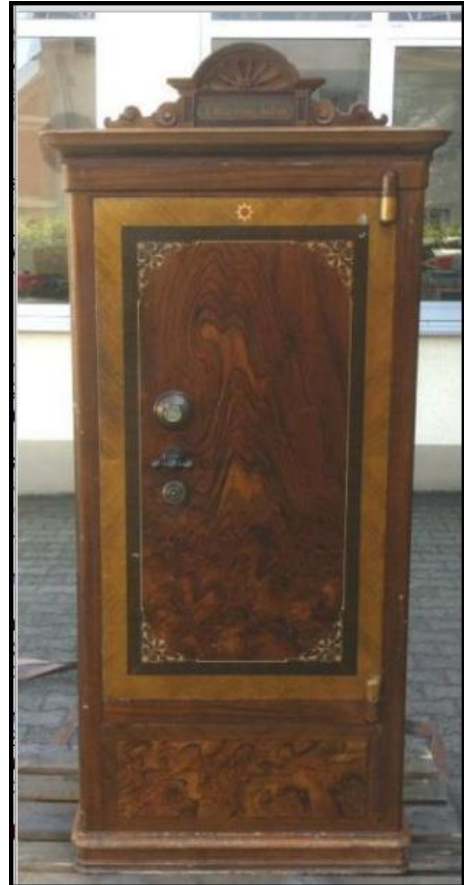
Die erste Anschaffung im Bürobereich war ein Kassenschrank

Rückenverstäuber, Stammholzwinde, Geburtshelfer (sicher für Kälber und nicht für Kinder) und eine Viehwaage fanden sich in der Inventurliste 1957.