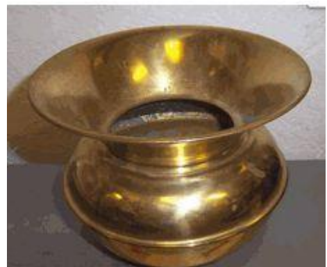
Auch ein Spucknapf gehörte damals zur Schulausstattung

Das Rathausamtzimmer ist wöchentlich feucht zu wischen; die Möbel sind vom Staub zu reinigen, jegliche Staubentwicklung ist zu vermeiden. Alle 4 Wochen muss das Zimmer aufgewaschen werden, wobei auch die Fenster zu putzen sind. Die Registratur muss dreimal im Jahr einer gründlichen Reinigung unterzogen werden. Das Ölen des Fußbodens in der Kanzlei hat nach Bedarf und Anordnung zu geschehen. Die Reinigung des Sitzungssaales, des Bezirksamtzimmers nebst Warteraum wird jeweils gesondert bezahlt.