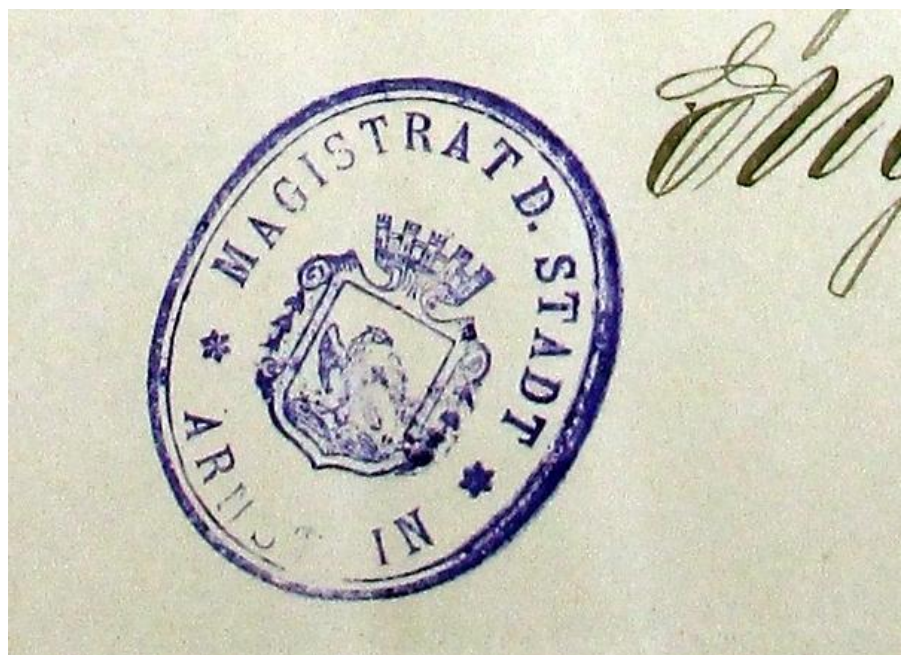
Stempel des Stadtmagistrats von 1902