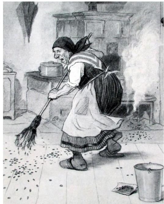
Viel Spaß machte es den Frauen damals sicherlich nicht, die schmutzigen Schulen zu reinigen (Fliegende Blätter von 1914)