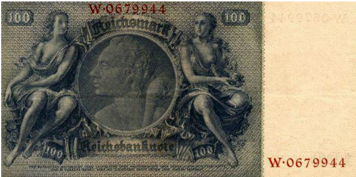
Hundert Reichsmark war Nellers monatlicher Lohn

wurde aufgenommen: „Die Kündigungsfrist beträgt einen Monat. Bei Nichterfüllung der ihr auferlegten Pflichten hat sofortige Entlassung zur Folge.“