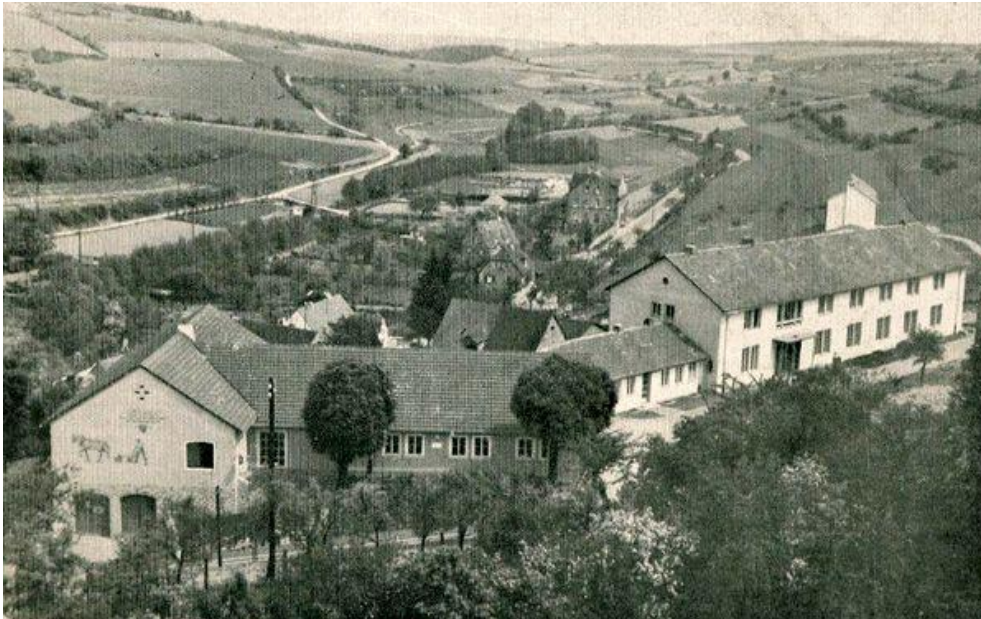
Die Landwirtschaftsschule am Schützenberg