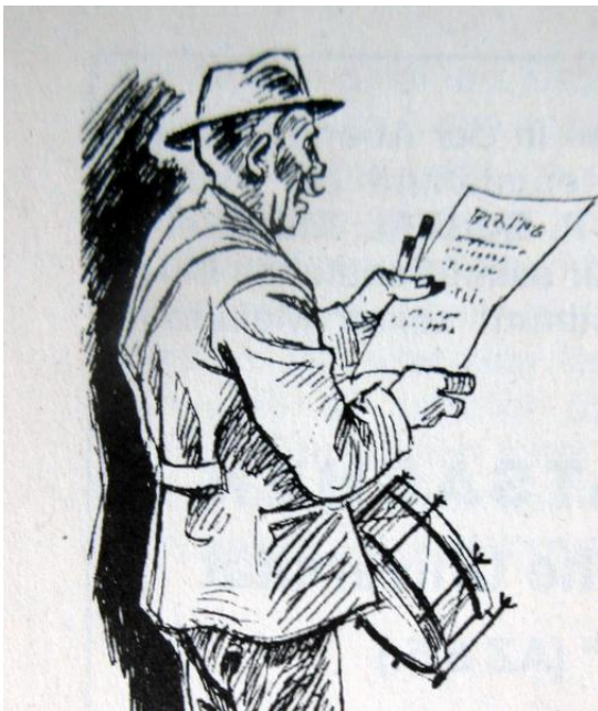
Früher wurden die Informationen der Stadtverwaltung durch einen Ausrufer bekanntgegeben