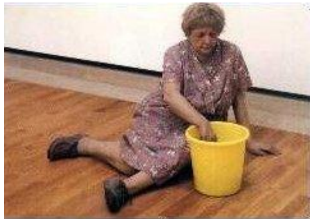
Putzfrau (Gemälde in der Staatsgalerie Stuttgart)

Bei Beginn der Weihnachts-, Oster- und Herbstferien sind die Wände, die Decken schonend abzukehren, die Holzverkleidungen der Wände abzuwischen, worauf die Fußböden und Fußleisten der Bänke zu ölen sind. Die zur Reinigung erforderlichen Geräte werden von der Stadt gestellt.