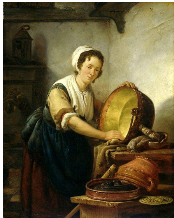
Die Schuldienerin hatte mannigfaltige Aufgaben (Gemälde von Abraham von Strij)