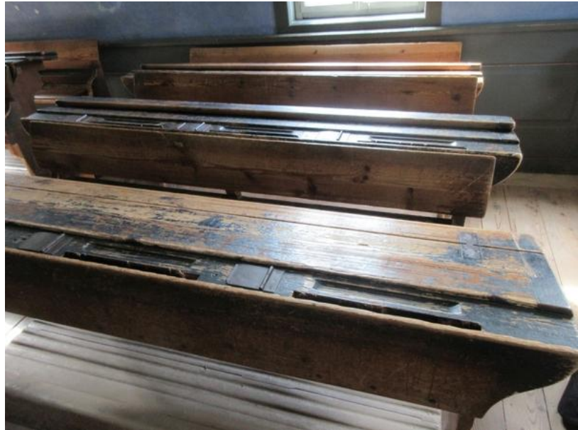
So sahen damals die Schulbänke aus (Freilandmuseum Fladungen)

Die Beheizung der Schulzimmer muss, sobald es geboten erscheint, erfolgen. Bei Beginn des Unterrichts muss das Schulzimmer eine Temperatur von 16 bis 18 Grad Celsius haben.