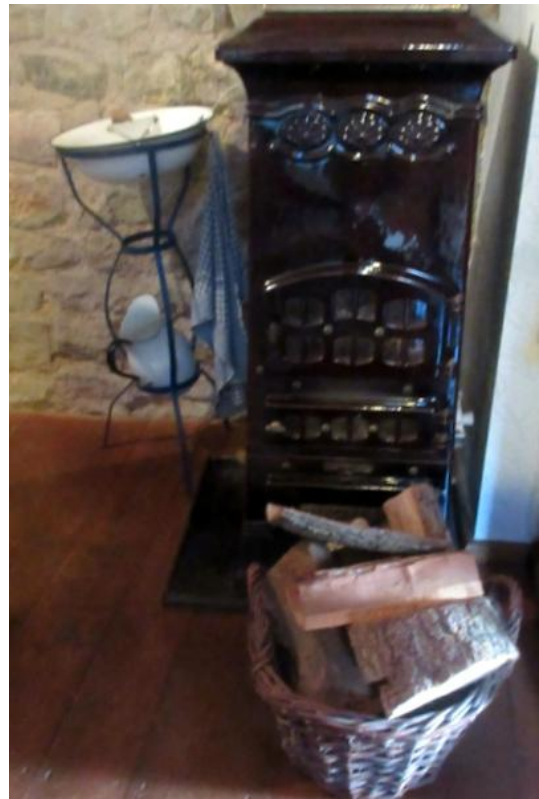
So ähnlich könnten die Öfen in den Schulen damals ausgesehen haben