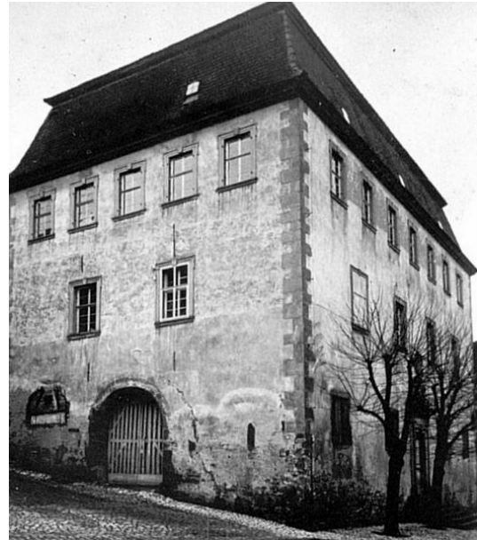
Die Schuldienerin musste auch die Kanzleiräume im Rathaus putzen