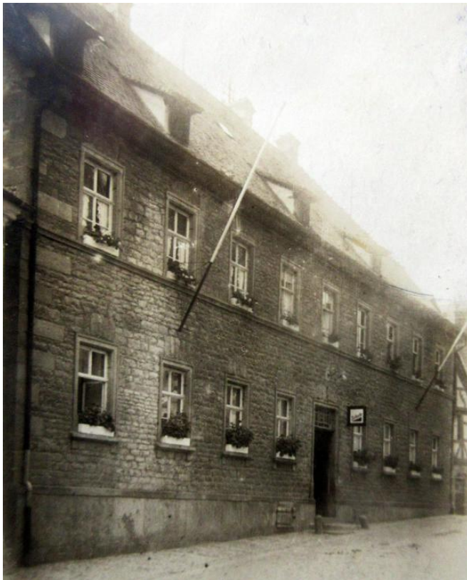
Das Schulgebäude in der Marktstr. 30