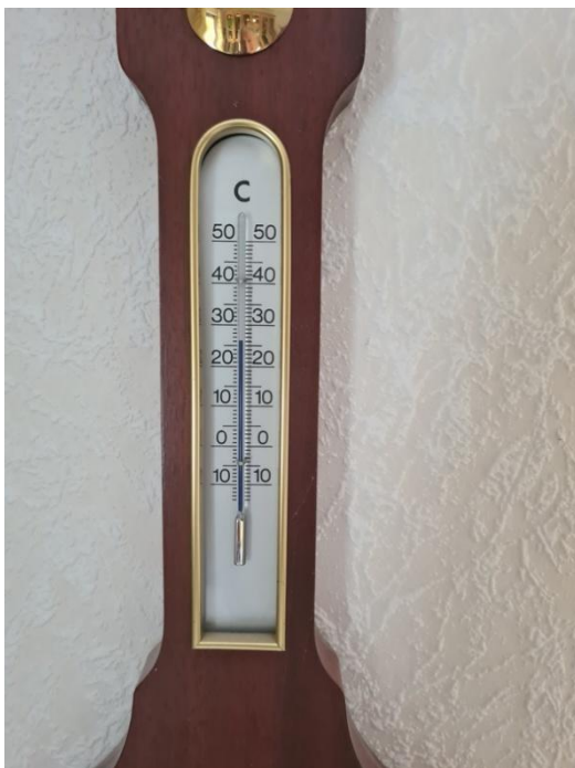
Die Schulzimmer mussten eine Temperatur zwischen 15 und 18 Grad haben

Der Magistrat unter dem Vorsitz des Bürgermeisters Franz Leußner (*6.6.1831 †8.3.1893) beschloss mit dem protokollierenden Stadtschreiber Joseph Engelbrecht (*10.9.1816 † in Würzburg) am 9. Dezember 1878: